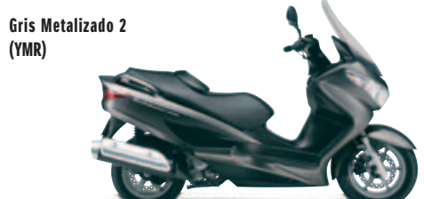
Foto: BURGMAN 200