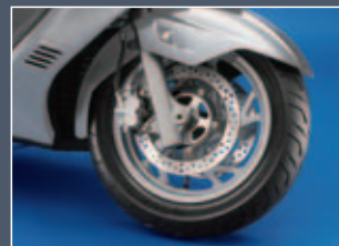
Doble e disco delantero de 260 mm y rueda de 14"

La BURGMAN 400 cuenta con un potente sistema de frenado que no desentonaría montado en una motocicleta deportiva. La rueda delantera cuenta con un doble disco de 260 mm que ofrece una gran capacidad de frenada y una perfecta dosificación. La rueda trasera monta un disco de 210 mm. Para mayor facilidad de uso y tranquilidad a la hora de aparcar, una cómoda palanca situada en el escudo acciona el sistema de bloqueo del freno trasero.