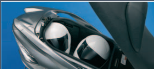
Hueco bajo el asiento de 62 litros de capacidad

La BURGMAN 400 demuestra que una motocicleta puede ofrecer un amplio espacio para equipajes si está diseñada de forma inteligente. Bajo el asiento dispone de un amplio hueco de 62 L de capacidad capaz de albergar dos cascos integrales o un maletín tamaño A3.