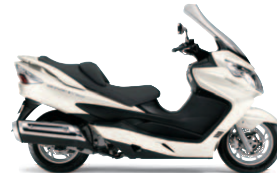
Blanco Nacarado (YPA)