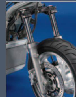
Horquilla delantera con barras de 41 mm

Un chasis rígido y ligero es la clave para una gran manejabilidad. Por ello el bastidor de la BURGMAN 400 está formado por tubos de gran diámetro y pared fina que combinan bajo peso con una gran resistencia a la torsión. Para una mayor estabilidad y un pilotaje más relajado, este chasis se apoya en una horquilla telescópica con 110 mm de recorrido y un sistema trasero progresivo, similar al de las motocicletas de gran cilindrada. La rueda delantera alcanza un diámetro de 14" para obtener gran estabilidad y permitir un ángulo máximo de inclinación de 43°. En resumen, una estabilidad equiparable a una motocicleta y una excepcional manejabilidad.