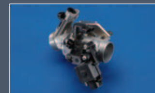
Inyección electrónica con sistema ISC