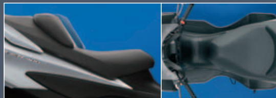
Asiento biplaza con respaldo ajustable

Para un gran confort, el asiento biplaza en dos niveles cuenta con respaldo para el piloto y se encuentra a tan solo 710 mm de altura al suelo. El respaldo es ajustable en cinco pasos de 10 mm. Además, las plataformas para los pies están recortadas para permitir un fácil acceso al suelo sin perjudicar al confort.