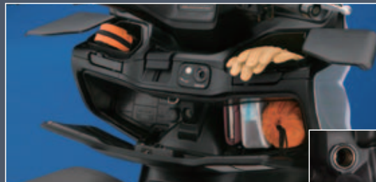
Tres guanteras con tapa

También se dispone de un compartimento ideal para pequeños objetos personales. Este área se ilumina mediante una luz de cortesía que puede desconectarse fácilmente. En la parte frontal encontramos tres guanteras, la mayor de ellas con cerradura y una capacidad de 10 L, con toma de corriente de 12V en su interior para recargar en marcha el teléfono móvil u otro accesorio.