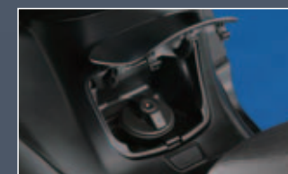
Depósito de 14 litros de capacidad