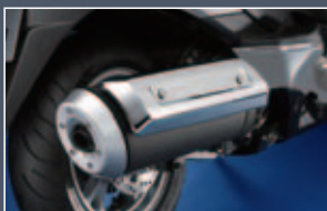
Protector anti quemaduras de escape