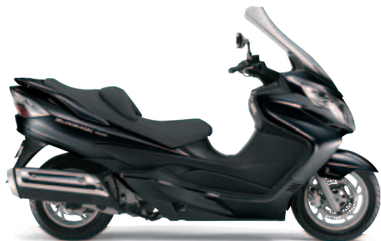
Negro Perla Nebulosa (YAY)