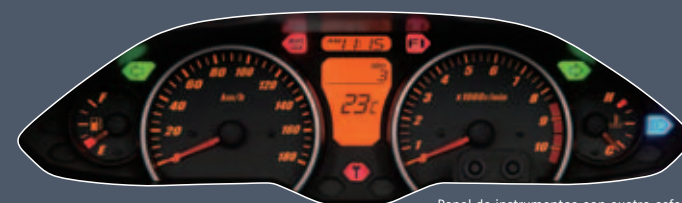
Panel de instrumentos con cuatro esferas fácil de leer

El panel de instrumentos de la BURGMAN 400 es completo y fácil de leer. Además del velocímetro, incorpora tacómetro, cuentakilómetros con doble parcial, reloj horario e indicadores de temperatura ambiente, consumo de combustible, nivel de gasolina y temperatura del refrigerante. Su limpio diseño con dos esferas principales, dos secundarias y panel digital permite al conductor ver toda la información de un vistazo.