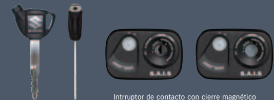
Interruptor de contacto con cierre magnético

Como elementos de seguridad antirrobo, el interruptor principal cuenta con un cierre de accionamiento magnético y el sistema inmovilizador electrónico SAIS. El SAIS se sirve de señales de radio para comunicarse con un chip incluido en la llave, impidiendo poner la moto en marcha si no se hace con la llave adecuada dotada del código correcto.