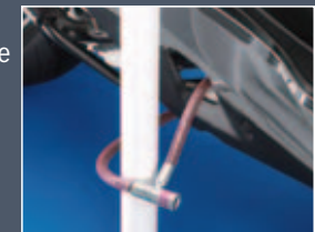
Abertura para antirrobo

Además hay una abertura en la carrocería que permite pasar una cadena de seguridad abrazando el chasis y atar la moto a un objeto sólido.